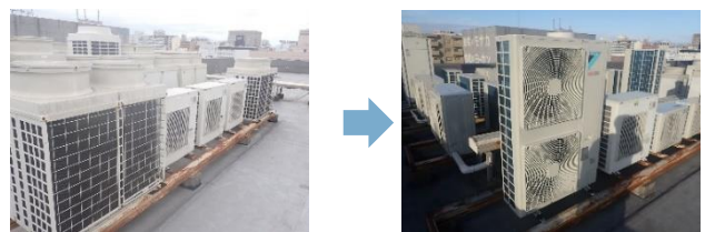
老朽化した空調設備