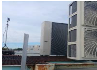
直射日光を受ける室外機