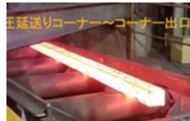
加熱炉口の空気流入制御